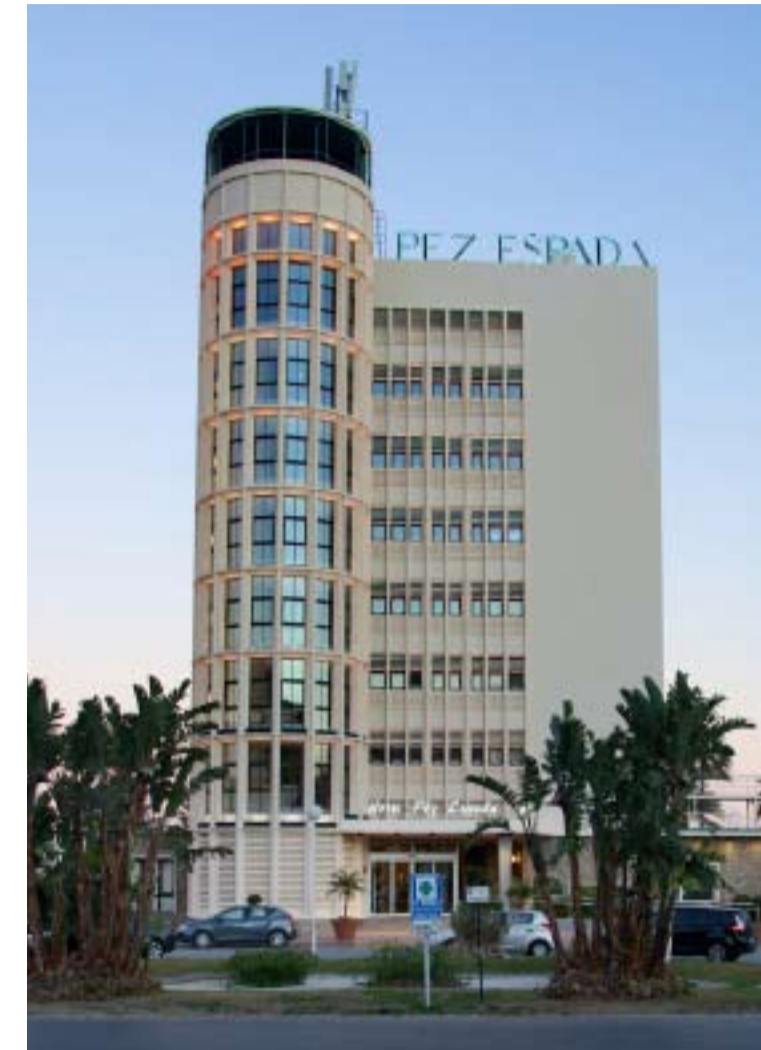
El Pez Espada es uno de los hoteles emblemáticos de Torremolinos (Málaga).

El nuevo edificio anexo se ha ejecutado en un tiempo récord y abrirá sus puertas tan solo siete meses después