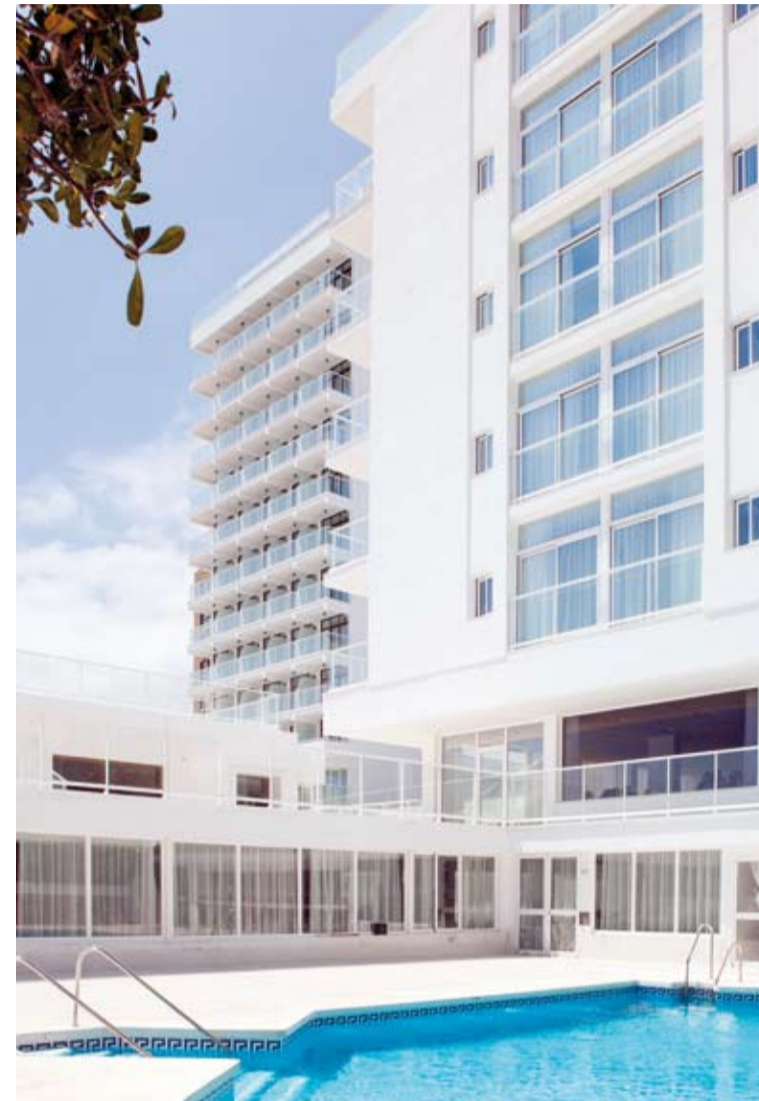
El establecimiento también ha reformado la fachada exterior.