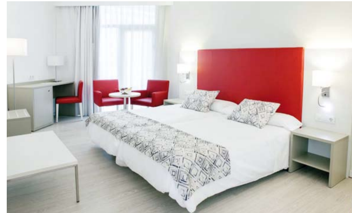
La decoración de las habitaciones aporta mayor luminosidad, amplitud y calidez.