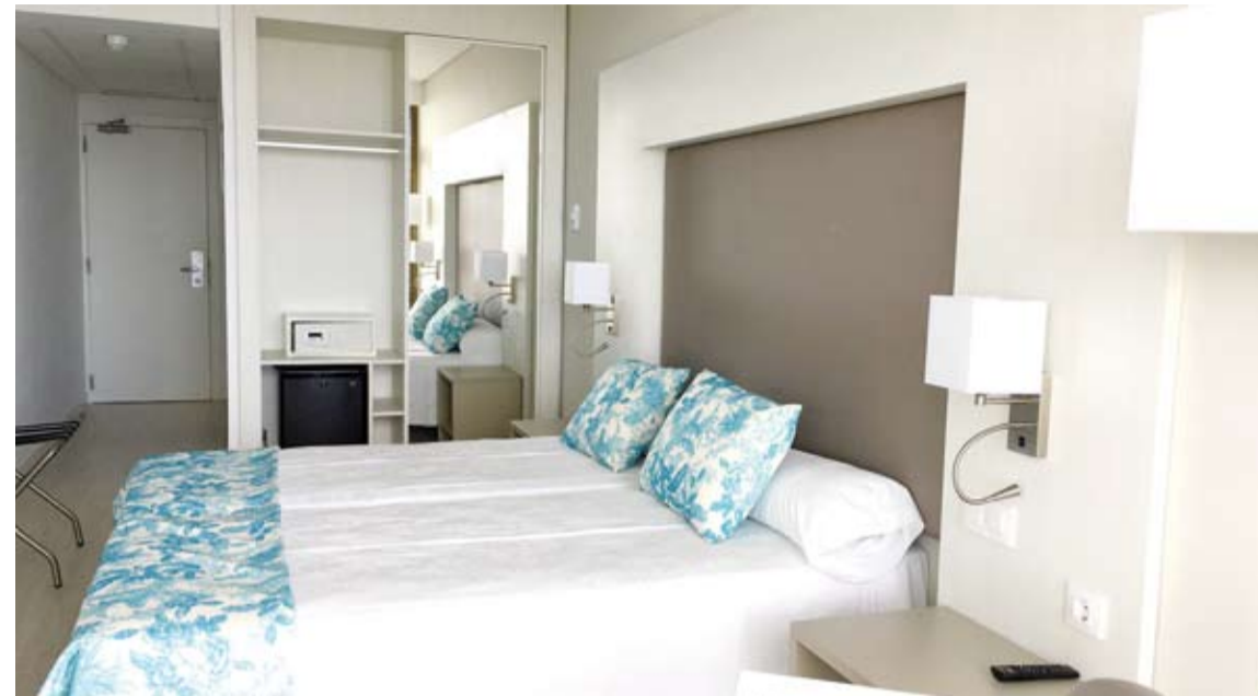
El Hotel Alay cuenta con un total de 246 habitaciones de gran confortabilidad.

MÁLAGA / ESTABLECIMIENTO A ESCASOS METROS DE LA PLAYA DE BENALMÁDENA Y JUNTO AL PUERTO DEPORTIVO