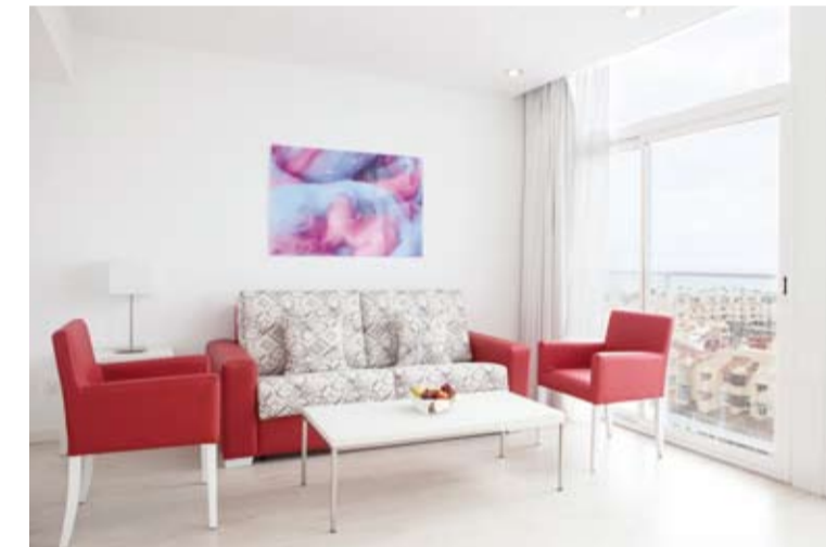
Vista de una de las suites.

Para llevar a cabo la reforma del Hotel Ibersol Alay, la compañía ha confiado en una firma andaluza de primer nivel líder en el sector como es Intea, que ha realizado el equipamiento integral, tanto de habitaciones como de zonas comunes, desde mobiliario a armarios, cortinas, sillería, iluminación... "Intea nos ha aportado ese producto diferenciador que Ibersol estaba buscando y ha sido uno de nuestros pilares a la hora de crear este 'niño pequeño' que es el hotel Alay, que está dando sus primeros pasos y que llegará a colocar a Ibersol en el número 1 en la Costa del Sol. Intea ha llevado a cabo